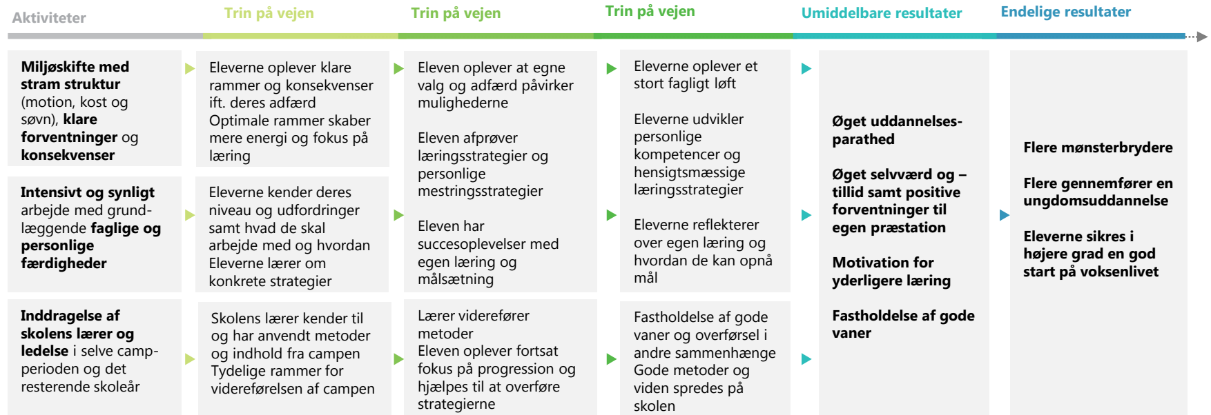
Illustration af sammenhæng mellem aktiviteter i læringsforløbet og forløbets mål:

Inddragelsen af skolens lærere og ledelse har til formål både at skabe tryk blandt eleverne i campperioden og at sikre overlevering og fastholdelse af viden og metoder fra campperioden til elevens efterfølgende forløb i skolen. Derudover kan skolens lærer anvende brugbare metoder og læring i andre undervisningssammenhænge samt sprede dem til andre undervisere på skolen. Således kan lærerens deltagelse i campen skabe værdi for andre elever og lærere på skolen. Den efterfølgende undervisning på egen skole skaber tydelige rammer for videreførelsen af læringen på campen og skal være med til at fastholde eleverne i den gode udvikling samt hjælpe dem med at overføre strategierne til andre sammenhænge.